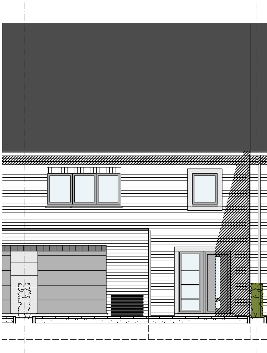
Maison 39 : Façade avant