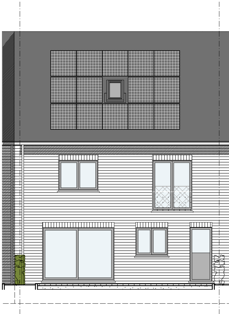
Maison 39 : Façade arrière